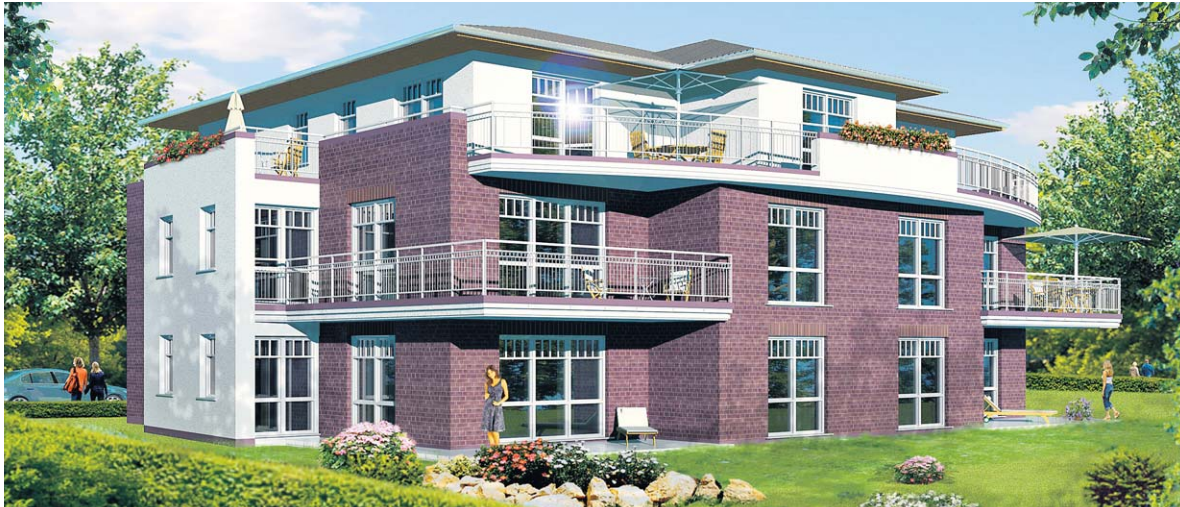
Hohe Bauqualität und eine stilvolle Ausstattung wie bei diesem Mehrfamilienhaus im Wellingsbütteler Weg 160 zeichnen viele Neubauprojekte im Bezirk Wandsbek aus.

Serie, Teil 5: Anbauten und Aufstockungen sind im Bezirk Wandsbek erwünscht, deshalb will man die Grundeigentümer unterstützen