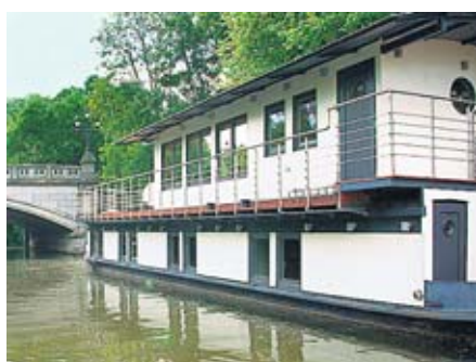
Unten liegen Schlafräume, das Bad und ein Wohnzimmer.

Das besondere Objekt Hausboot am Eilbek-Kanal in bester Stadtlage zu mieten. Ausgestattet ist es wie eine moderne Wohnung