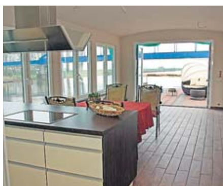
Blick von der offenen Küche zum oberen Wohnraum und dem Oberdeck.

Wohl kaum eine andere Adresse kann in Hamburg mit einer ähnlichen Geschichte aufwarten wie dieses Domizil an der Uferstraße. Hier auf dem Eilbek-Kanal liegt das Hausboot „Peißnitz“. Das Schiff wurde 1970 in Mukrena an der Saale als Wohnschiff für Mitarbeiter des damaligen VEB Wasserstraßenbetriebs Magdeburg gebaut und war auf den Namen der Saale-Insel getauft, die mitten in der Stadt Halle liegt. Nach der Wende wurde das Schiff ausgemustert. 2005 konnte es der jetzige Inhaber Henning Bossow erwerben, der es dann zu einem Hausboot mit einer Wohnfläche von 110 m 2 umbaute – mit bemerkenswerten Detaillösungen. Der endgültige Ausbau erfolgte erst nach der Überführung nach Hamburg am jetzigen Liegeplatz.