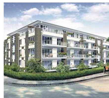
In den Bramfelder Höfen sollen 19 Wohnungen entstehen.