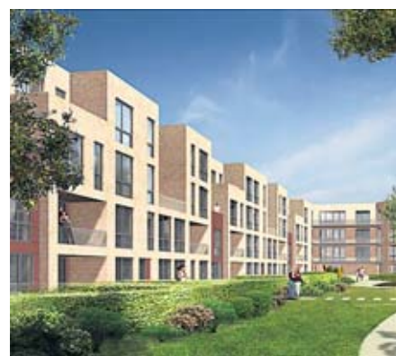
Die Genossenschaft Dennerstraße hat in diesem Bau 58 Wohnungen erstellt.